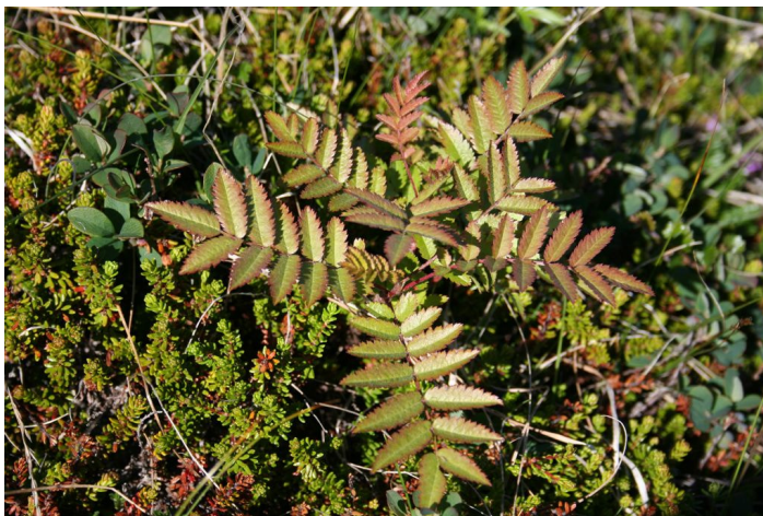
Mynd 2. Lítil reynivíðarplanta vex í lyngmóa á Bakka.